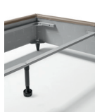
БАЛКА ДЛЯ 2-Х ОДНОСТАЛЬНЫХ РЕШЕТОК